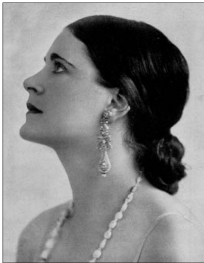
HARRIET COHEN, 1929